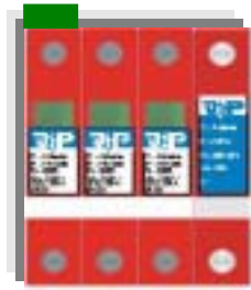
P-VMS FM 3+N